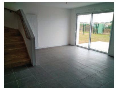
La pièce de vie principale

HABITAT 17 a bénéficié de prêts accordés par la Banque des Territoires ainsi que de subventions de l'État et du Conseil Départemental, le terrain ayant été mis à disposition d'HABITAT 17 par bail emphytéotique par la commune.