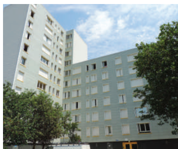
Le bâtiment « 409 » voué à la démolition